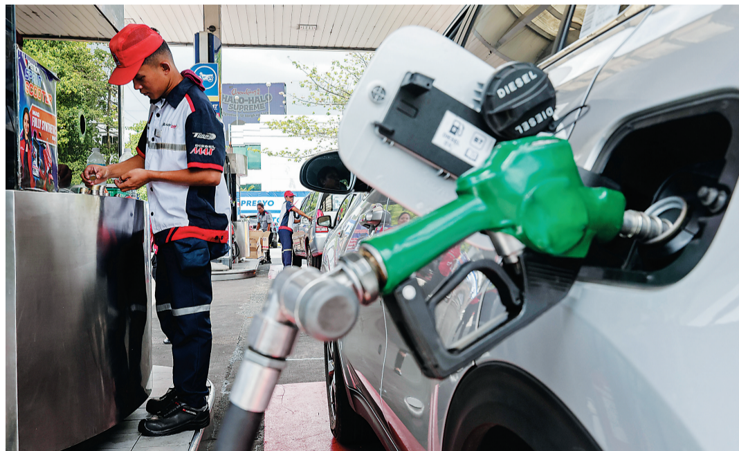
菲律宾奎松市，加油站工作人员清点用于找零的菲律宾比索硬币。

菲律宾国家统计局5日发布数据显示，该国4月通胀率为7.2%，较3月上升3.1个百分点，为连续第五个月上行，也创下自2023年4月以来最高水平。