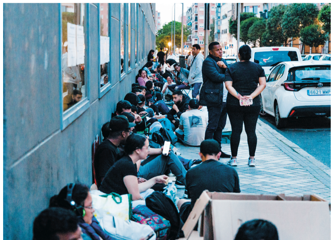
21日，西班牙马德里，民众在登记协助办公室排队办理脆弱性证明。

当地时间4月22日，西班牙政府推动的移民身份合法化程序正式启动，预计约50万人将通过预约前往社会保障局、外国人事务办公室或邮局办理相关手续。