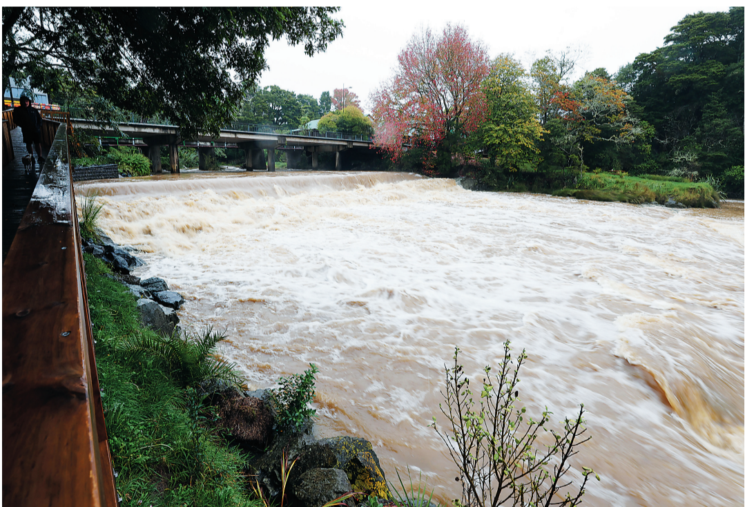
12日,新西兰奥克兰,沃克沃思的马胡朗伊河在暴雨后的景象。

新西兰首都惠灵顿大区当地时间20日宣布,受连日来持续强降雨影响,惠灵顿进入紧急状态。与此同时,新西兰气象部门已将惠灵顿及怀拉拉帕地区的暴雨警报上调至红色,并将持续至21日晚间。