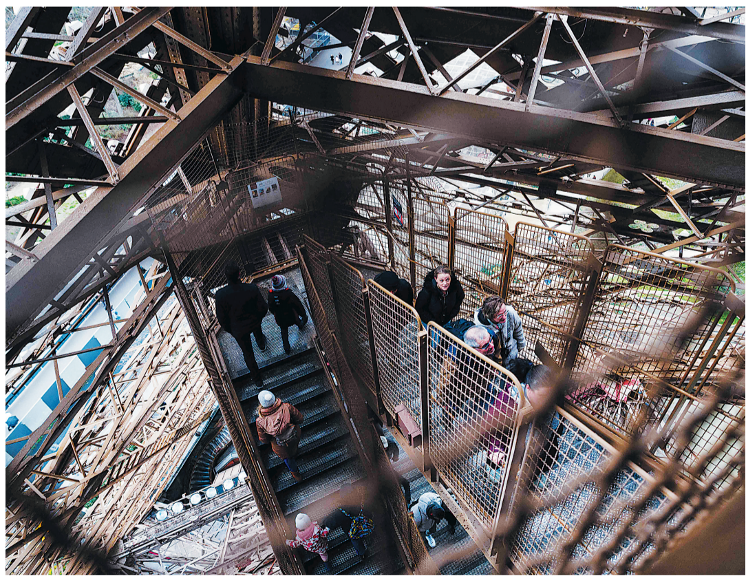
法国巴黎埃菲尔铁塔，游客爬上楼梯。

据新华社消息，法国埃菲尔铁塔一段“原装”楼梯定于5月21日由艾德拍卖公司在巴黎拍卖。目前已有多名潜在买家对这段楼梯表现出兴趣。