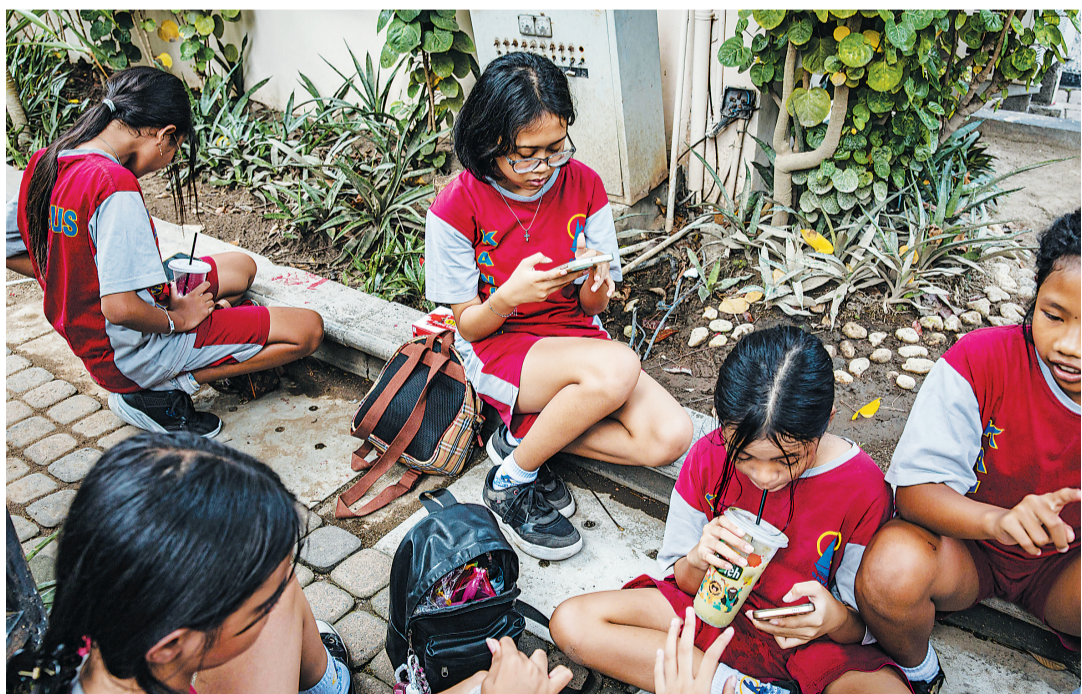
27日,印度尼西亚日惹,小学生在课外活动后使用智能手机。视觉中国/图

印度尼西亚政府28日起正式实施针对16岁以下人群的社交媒体禁令,以防青少年陷入网络色情、网络霸凌、网络诈骗和网络成瘾等问题。