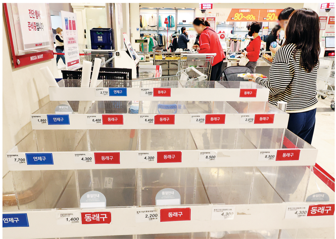
26日,韩国釜山,随着垃圾袋购买需求激增,Megamart超市的垃圾袋销售区已空无商品。

受中东地缘政治紧张局势持续发酵影响,全球石脑油供应趋紧,韩国国内对塑料及乙烯基类产品短缺的担忧升温,部分地区已出现垃圾袋限购现象。