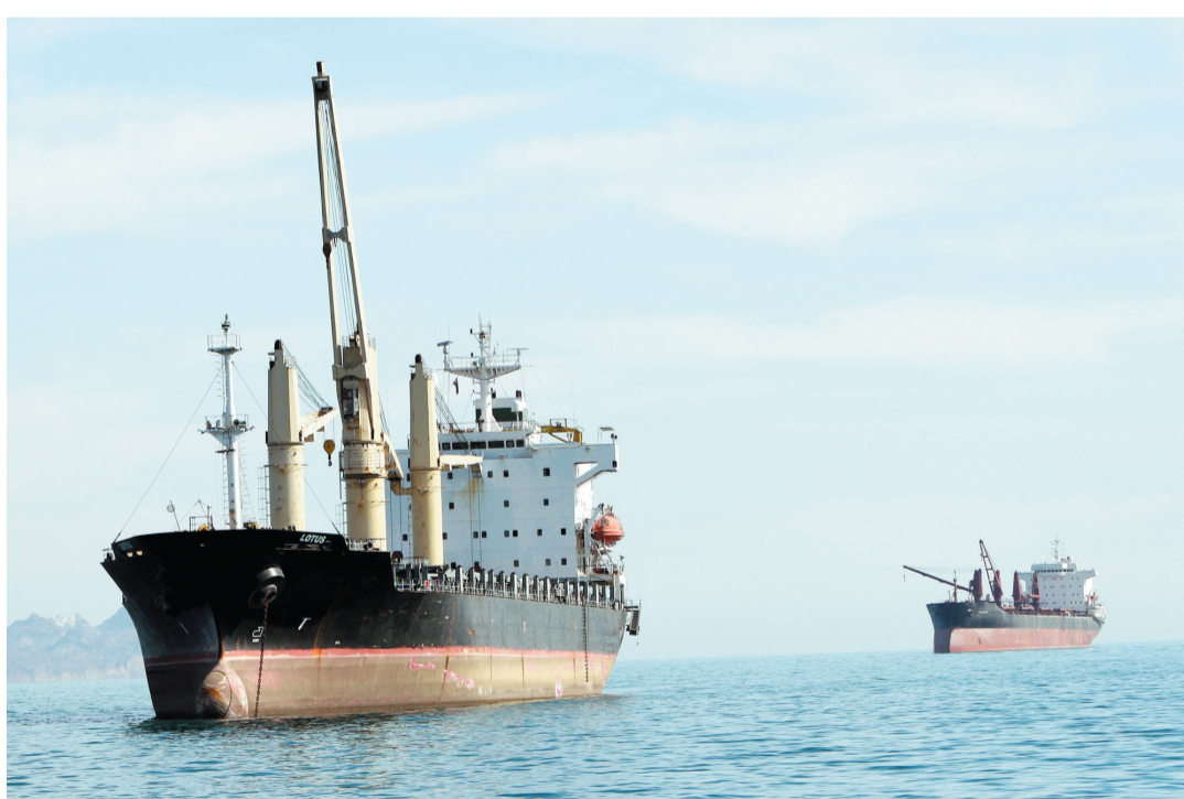
波斯湾地区紧张局势升级后，霍尔木兹海峡海上航运量明显下降。

自美以冲突爆发以来，全球能源运输“命门”霍尔木兹海峡航运严重受阻。市场服务机构数据显示，3月以来，商船通过这一海峡的次数较冲突前下降了95%。