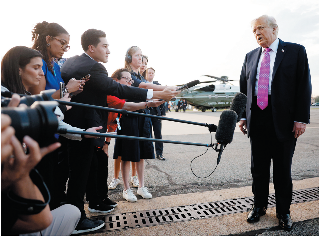
美国总统特朗普此前在莫里斯敦机场登机前接受记者采访。

据央视新闻报道，美国总统特朗普当地时间15日就英国广播公司（BBC）剪辑拼接其讲话一事提起诉讼，共索赔100亿美元。诉讼在佛罗里达州南区联邦地区法院发起。